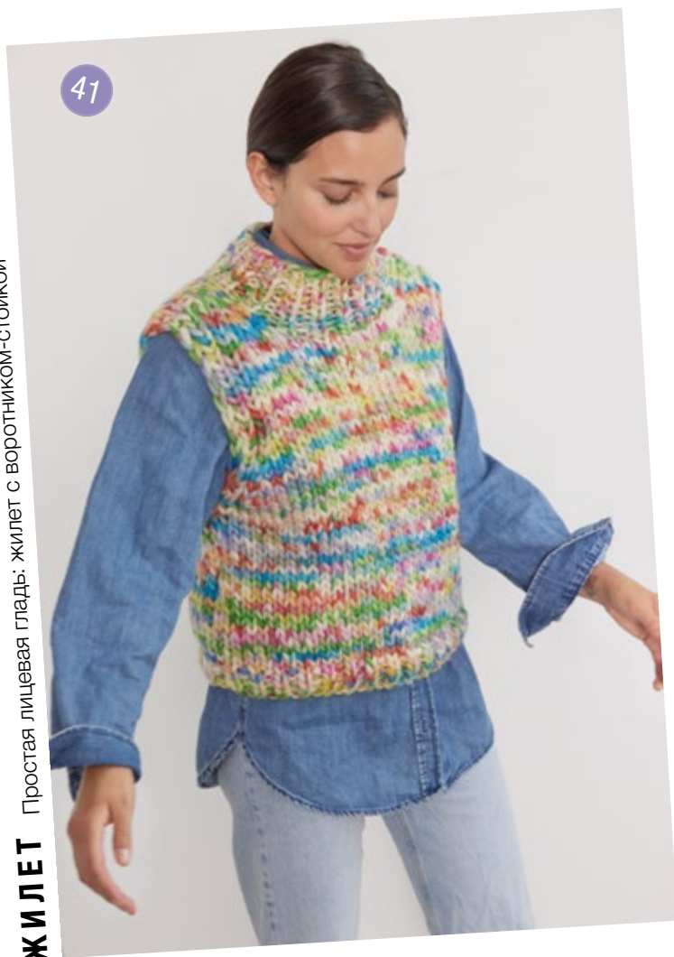
ЖИЛЕТ Простая лицевая гладь: жилет с воротником-стойкой