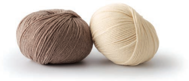
13 - Pullunder. Cool Wool Cashmere