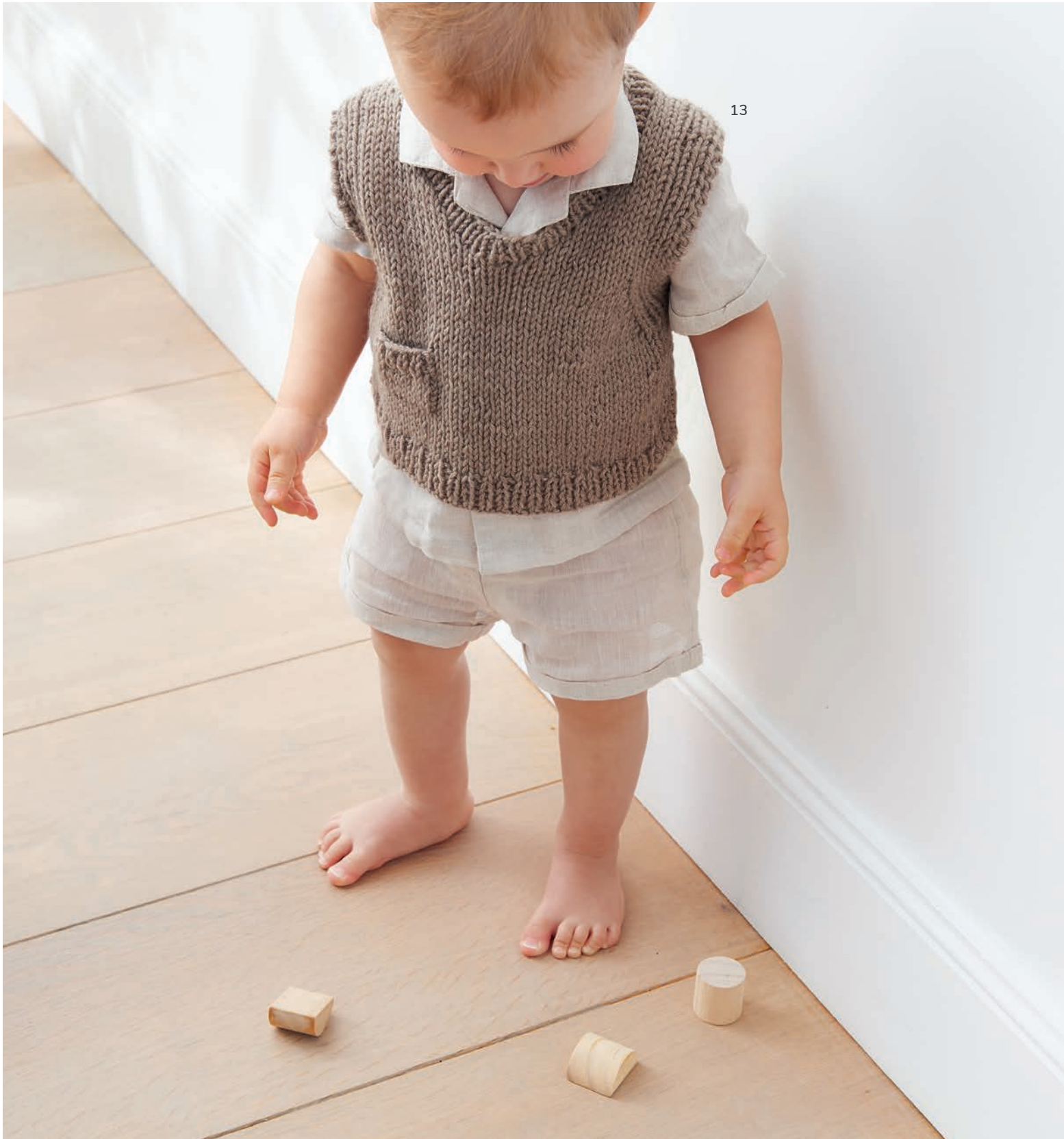
12 - Pulli. Cool Wool Cashmere