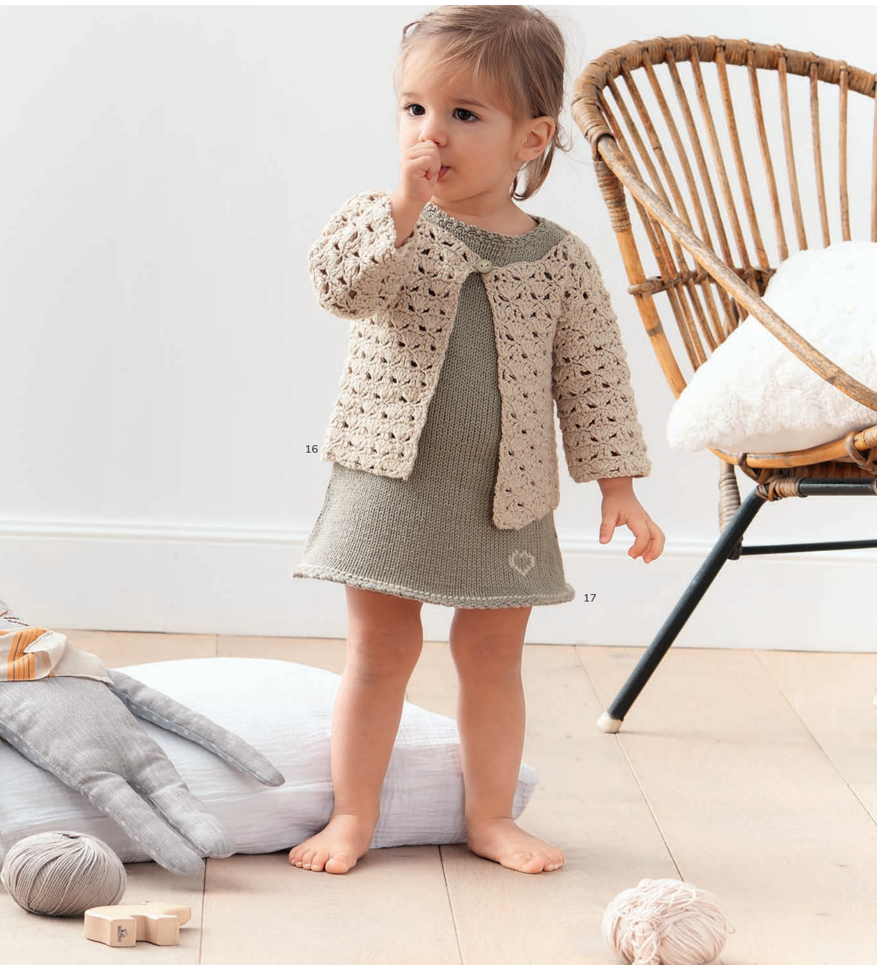
16 - Jacke. Soft Cotton