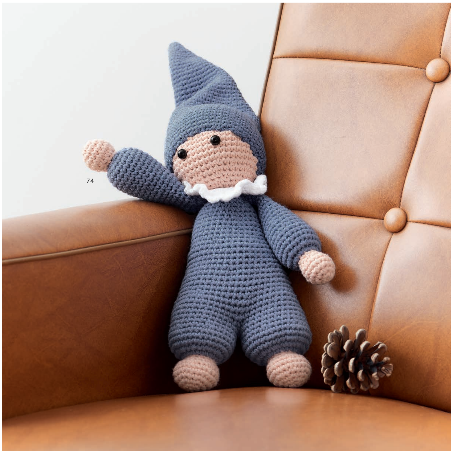
74 - Puppe. Imagine & Elastico