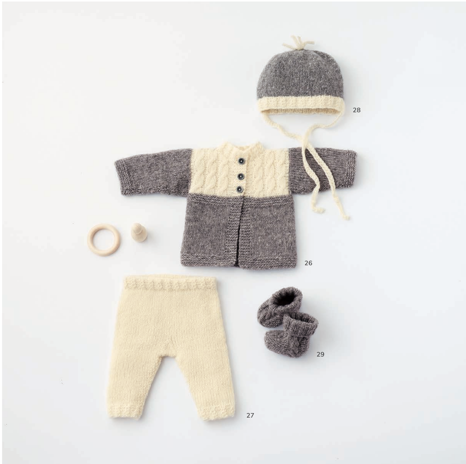
26 - Jacke. Cashmere 16 Fine