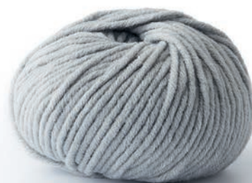
30 - Teppich. Mille II & Elastico